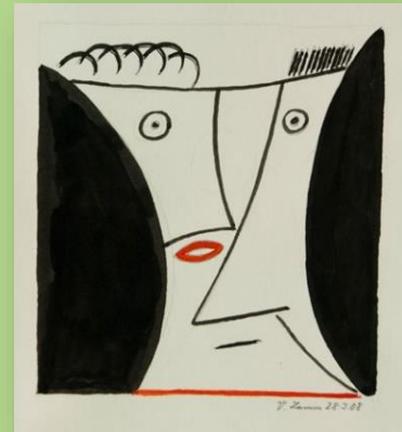
Künstler: Vinzenz Lamm

www.inklusionsmesse-rlp.de inklusion - gewusst wie!